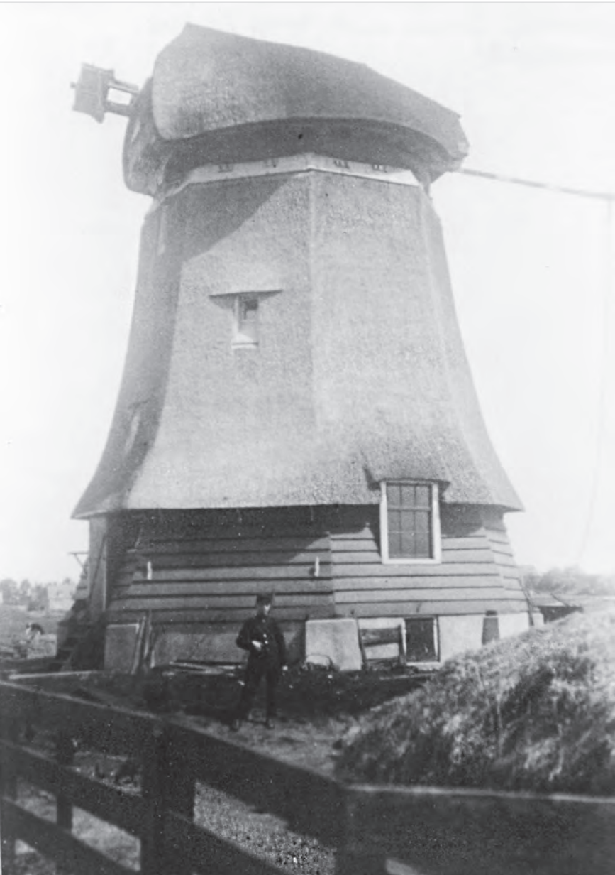
21 DE AFTAKELING VAN 'DE SPIN'. DE WIEKEN ZIJN OM VEILIGHEIDSREDENEN REEDS VERWIJDERD (1926).

Het zal duidelijk zijn: de kosten stonden nu in geen verhouding meer tot de waarde van de molen, waarvoor in 1818 nog een brandverzekering was afgesloten tegen een herbouwwaarde van slechts f7.000,-!