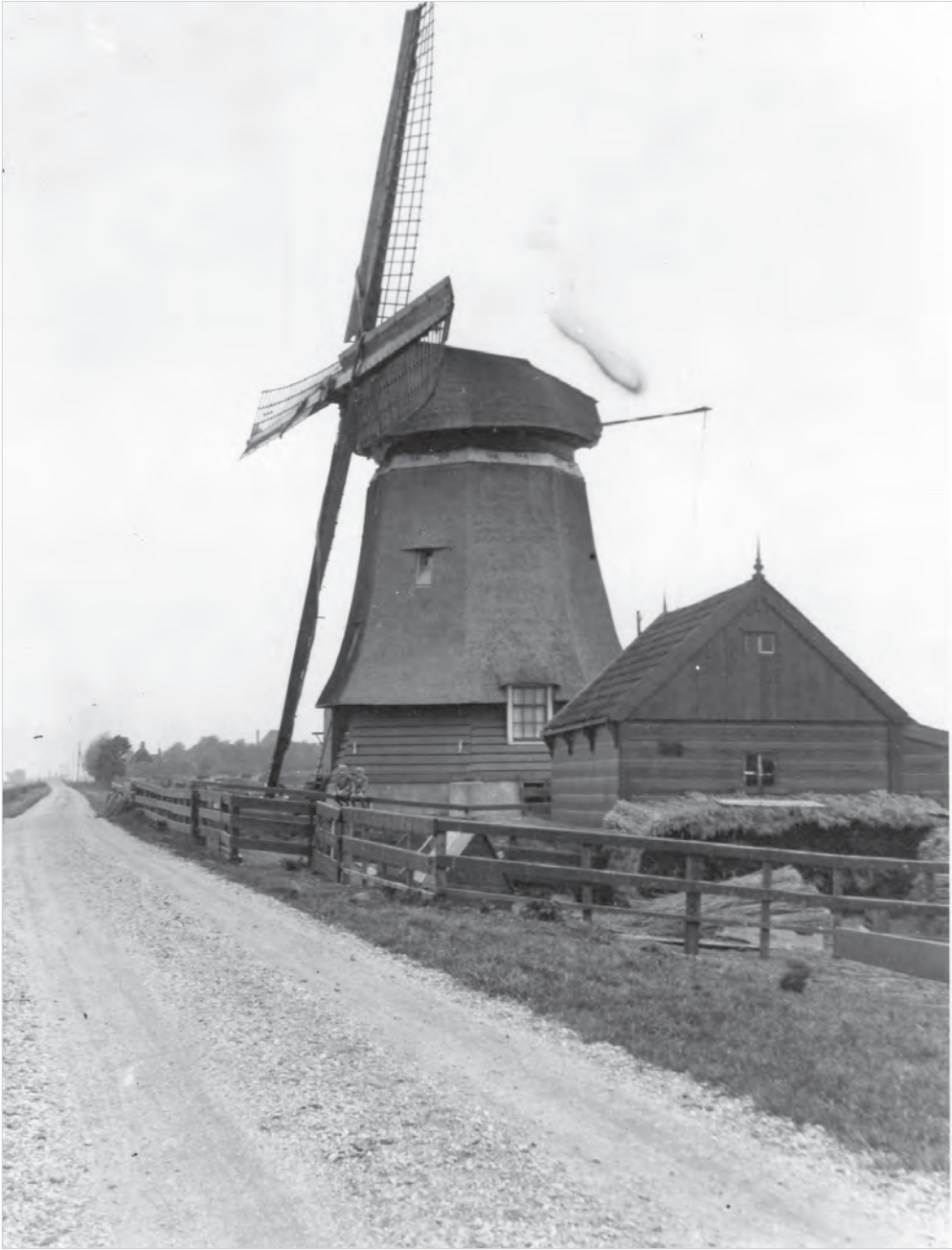
20 DE SPIN, GEZIEN RICHTING HET DORP, MET DE MOLENSCHUUR (1922).

Een molen is eigenlijk een levend wezen, hij staat in weer en wind en heeft veel te verduren. Hij behoeft dan ook regelmatig onderhoud en dat beperkt zich niet tot het smeerwerk (bijenwas voor de kamraderen en varkensreuzel voor de bovenas). Ook diende er geschilderd te worden, eens in de vier jaar de hele molen en elk jaar de roeden. De laatste zwart met een witte voorzoom zodat ze ook ‘s nachts zichtbaar waren. Ook de molenzeilen, aanvankelijk van hennepdoek en later van zwaar katoen, hadden veel te lijden en moesten om de vijf jaar geheel worden vernieuwd. Daartoe had het polderbestuur een onderhoudscontract afgesloten met zeilenmaker Dirk Prook uit Krommenie.