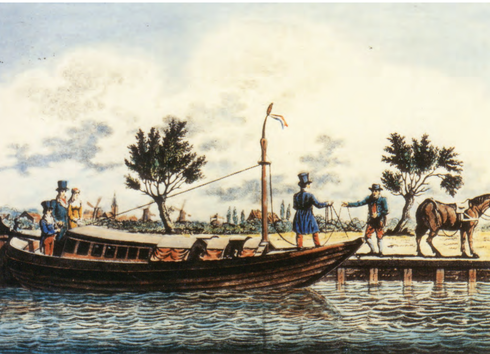
16 DE TREKSCHUIT WAS TOT 1880 ZEER POPULAIR VANWEGE ZIJN REGEELMAAT EN RELATIEF LAGE KOSTEN. VANAF 1750 ZAT ER EEN ROEF (KAJUIT) OP DE BOTEN ZODAT MEN DROOG KON ZITTEN. DAT WAS EEN GROTE VOORUITGANG.

geen problemen omdat de regel bestond dat op het zelfde traject de mast van de ene schuit hoger moest zijn dan de ander, zodat de lijnen over elkaar heen gleden. Het jaagloon was voor Wijbrand geen vetpot en werd bepaald naar 'ieder uur afstand per paard' (80 ct. per paard per uur).